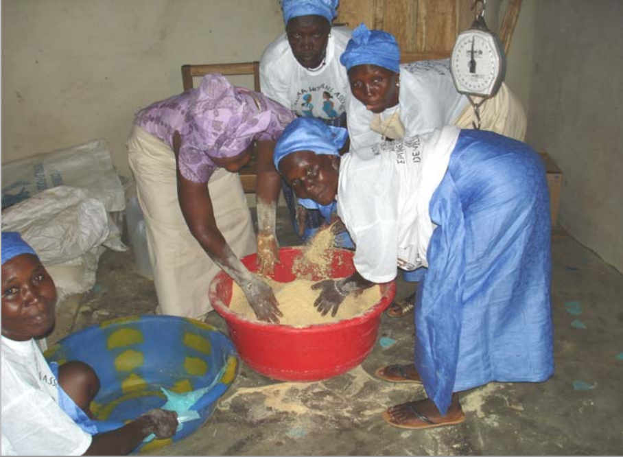
Frauen auf Bonthe bei der manuellen Verarbeitung der Kassava-Wurzel