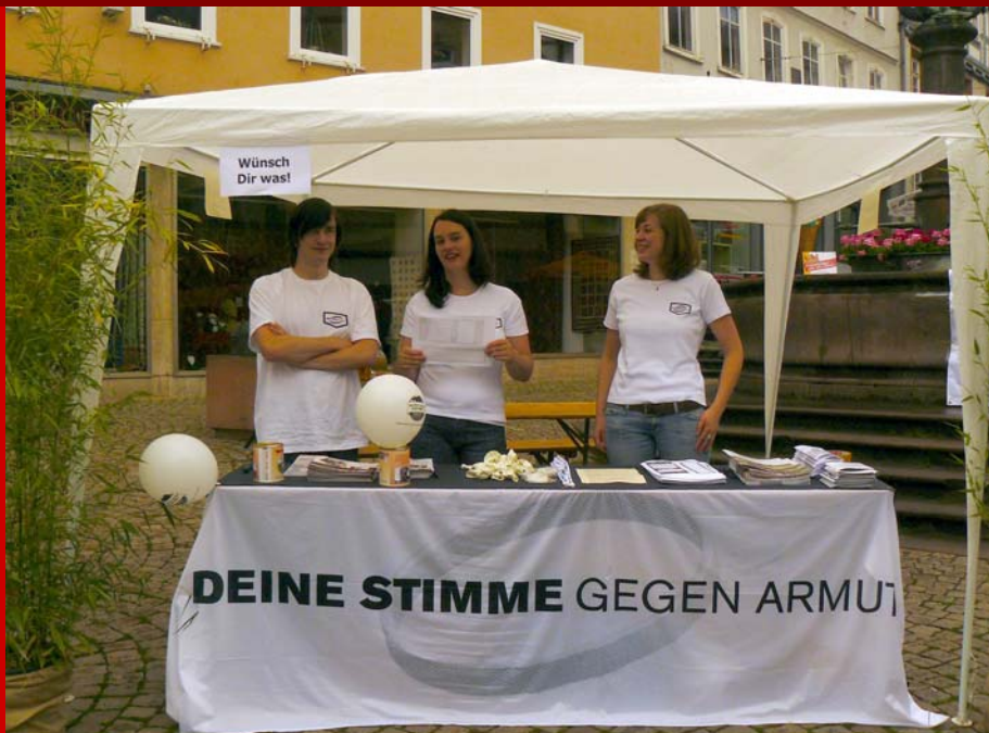
Ehrenamtliche Helfer von Terra Tech unterstützen die Wünsch-Dir-Was-Aktion