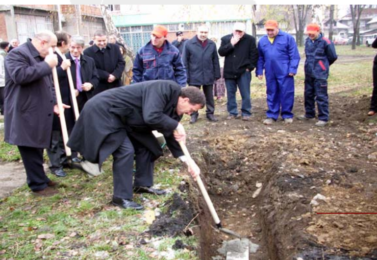
Lokale Repräsentanten bei der Grundsteinlegung des Frühförder- und Behandlungszentrums im Dezember 2008