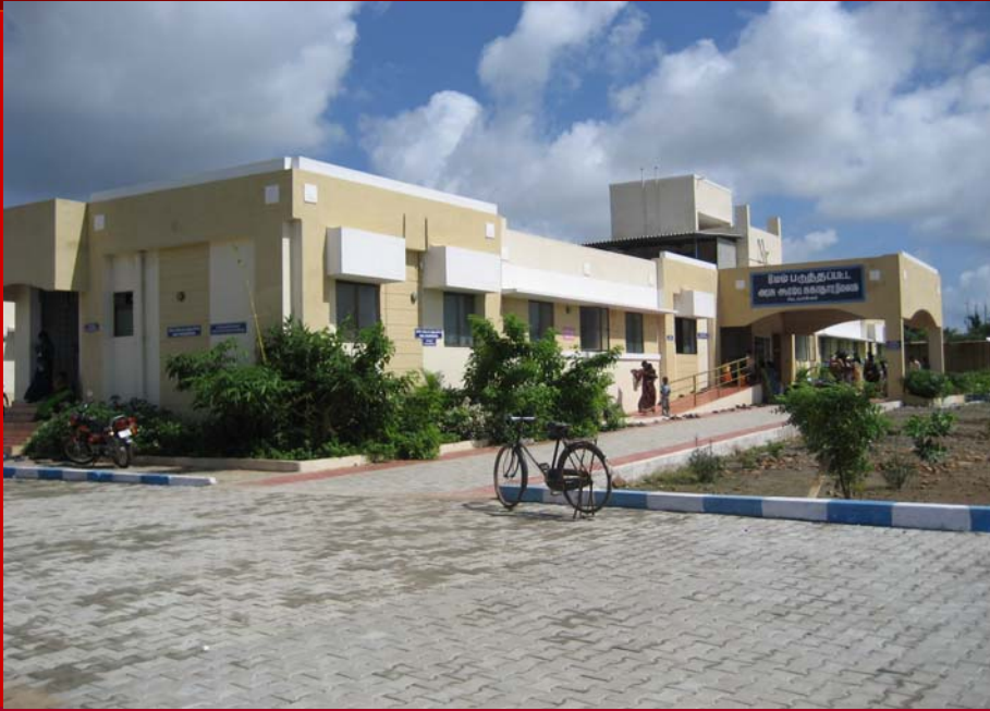
Der fertige Bau des Krankenhauses im November 2008