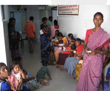
Kinder und Frauen im neuen Krankenhaus in Medavakkam warten auf ihre Behandlung

Möglich war die Durchführung der Projekte mit der finanziellen Unterstützung der Aktion Deutschland Hilft und unserer lokalen Partnerorganisation The Catalyst Trust , die sich für die Rechte gesellschaftlicher Randgruppen einsetzt und die Bauvorhaben vor Ort betreut und kontrolliert hat.