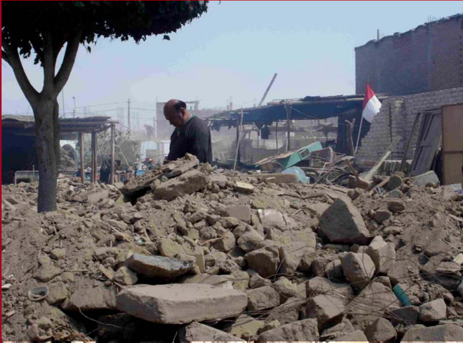
Ausmaß der Zerstörung unmittelbar nach dem Beben im August 2007