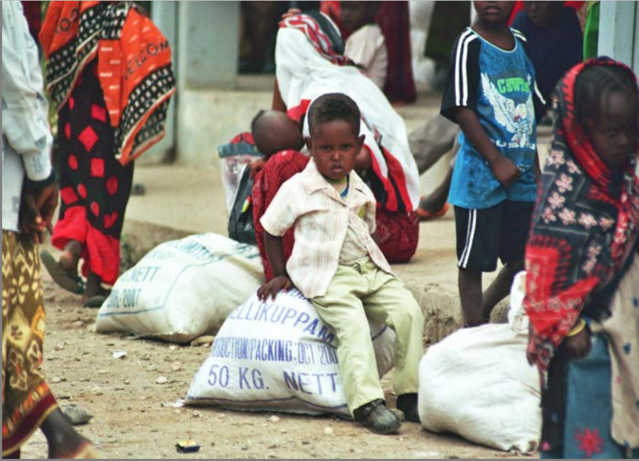
Kind bei der Verteilung von Hochenergienahrung an einer Gesundheitsstation