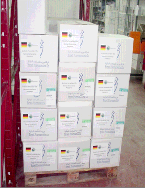
Medikamentenlager im Al Awda-Krankenhaus in Jebelja (Gaza)