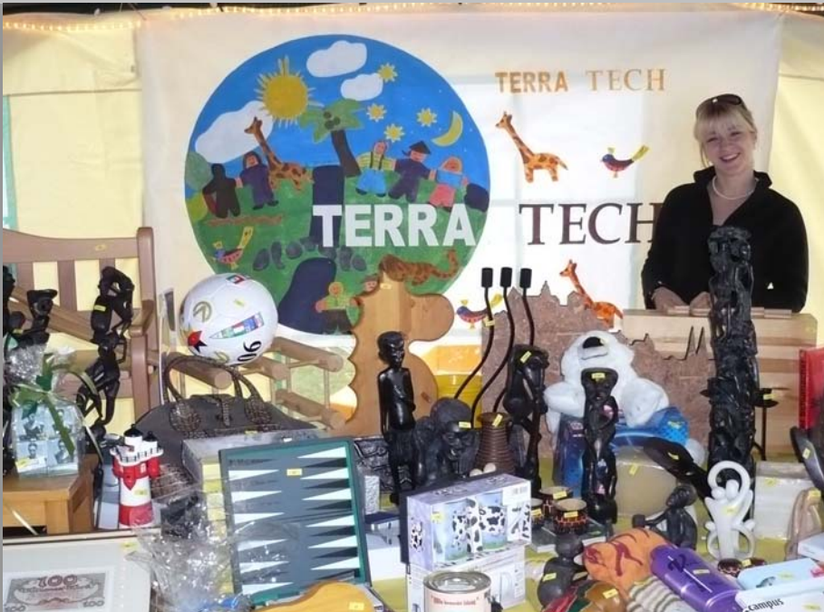
Zu gewinnende Preise bei der Tombola auf dem Stadtfest 3 Tage Marburg