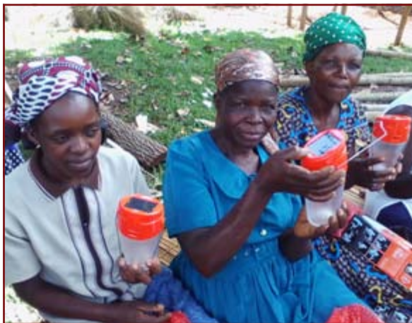
Mütter mit neuen Solarlampen

Im Februar 2013 hat TERRA TECH in Zusammenarbeit mit dem lokalen Partner Tembea im kenianischen Distrikt Siaya mit einem Projekt zur Förderung der Nutzung von Solarlampen begonnen. Viele Haushalte in der Region nutzen derzeit noch selbst gebaute, gesundheitsschädliche Öl- und Paraffinlampen. Deren Verwendung birgt hohe Risiken. Einerseits ist die Belastung der Atemwege durch Verbrennungsgase extrem hoch - die Belastung ist vergleichbar mit den Folgen des Konsums von zwei Packungen Zigaretten am Tag - andererseits kommt es