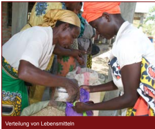
Verteilung von Lebensmitteln

In dem Gebiet nördlich von Kisumu wurde insbesondere die Widerstandskraft der Bevölkerung gegen Dürreperioden gestärkt. Entlang des Flusslaufs des Nzoia Rivers