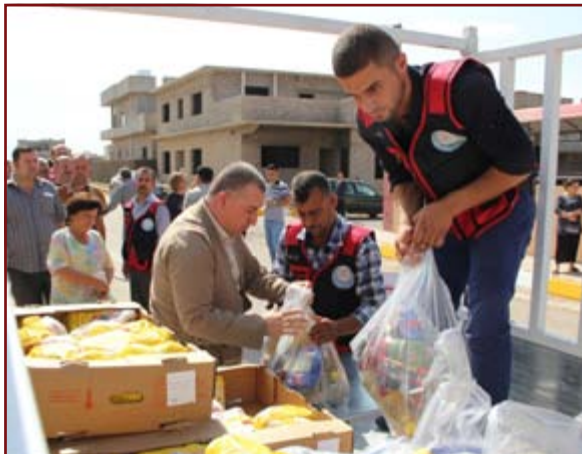
Verteilung von Hilfsgütern