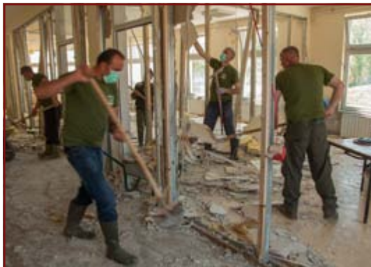
Aufräumarbeiten im zerstörten Förderzentrum

Auch das Förderzentrum für Menschen mit Behinderung in Maglaj, das von Humanost betrieben wird, wurde schwer in Mitleidenschaft gezogen. Das Gebäude wurde während der Überschwemmungen vollständig geflutet. Infolgedessen mussten alle Zwischenwände herausgerissen werden. Die gesamte Inneneinrichtung sowie die Materialien für Therapien sind durch das Wasser völlig unbrauchbar geworden, zwei behindertengerechte Fahrzeuge wurden zerstört und das Außengelände verwüstet. Zurückhaltend kalkuliert beträgt der Schaden mindestens 150.000 €. Der Wiederaufbau des Zentrums ist für die Menschen sehr wichtig und eine große Herausforderung. Im September 2014 konnte der Tagesbetrieb in provisorisch hergerichteten Räumen wieder übergangsweise aufgenommen werden.