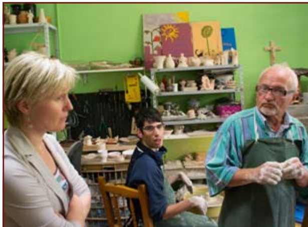
Fachlicher Austausch in einer Behindertenwerkstatt

und innige Eltern-Kind-Beziehung. Das geplante Projekt zielte darauf ab, eine Verbesserung dieser Verhältnisse zu erreichen. Dafür sollte Sensibilisierungs- und Aufklärungsarbeit geleistet werden, welche den Eltern aufzeigt, dass es neben den staatlichen Einrichtungen auch andere Betreuungsmöglichkeiten gibt. Angedacht war, ein Curriculum als Handreichung für medizinisches Fachpersonal zu erarbeiten. Dieses Handbuch sollte Betreuungsstrukturen von behinderten Kindern für zu Hause erklären und darstellen. Während der Projektreise nach Bulgarien wurden verschiedene Gesundheitseinrichtungen vor Ort besucht, um diese in die Projektplanung einzubinden. Bedauerlicherweise wurde dieses Projekt von unserem Zuwendungsgeber Aktion Mensch nicht bewilligt, sodass es nicht umgesetzt werden konnte.