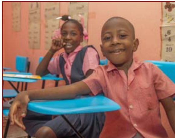
Kinder in der Schule von L'Arche Haiti in Carrefour

gutes Ansehen in der haitianischen Gesellschaft. Mittlerweile bringen Eltern ihre Kinder mit Behinderung zur Betreuung in die Einrichtungen, da sie verstanden haben, dass die Kinder trotz ihrer Behinderung ein annähernd normales Leben führen können und sich nicht nur im Haus aufhalten müssen. Sie möchten ihren Kindern ein besseres Leben ermöglichen: sie nutzen die Chance, ihren Kindern eine schulische Bildung und eine an ihre Bedürfnisse angepasste Betreuung zu bieten.