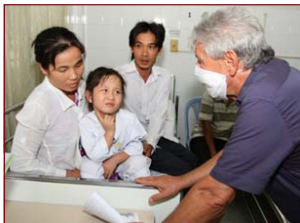
Kind und Eltern nach der Herzoperation

Seit 1986 bemüht sich die Stiftung Wirtschaft hilft Hungernden um die stetige Steigerung der Lebensqualität der Bevölkerung in hilfsbedürftigen Ländern. Unter dem Motto „Hilfe zur Selbsthilfe“ soll langfristig die Selbstständigkeit der Lebensgestaltung benachteiligter Bevölkerungsgruppen gewährleistet werden. Seit 1996 ist Vietnam eines der wichtigsten Einsatzgebiete der Stiftung. Als Spätfolge des Einsatzes des hochgiftigen Entlaubungsmittels „Agent Orange“ im Vietnamkrieg (1965-1975) werden heute immer noch viele Kinder mit schweren Herzfehlern geboren. Eine lebensrettende Operation am offenen Herzen kostet etwa 3.000 €. Einzig und allein Operationen können hier Leben retten. Bisher wurden unter dem Motto „From the Hearts to the Hearts“ 1210 solcher Herzoperationen von der Stiftung finanziert und von lokalen Ärzteteams durchgeführt. Im Dezember 2013 hat TERRA TECH die Projektarbeit der Stiftung übernommen und wird die lebensrettenden Programme für die kleinen Herzpatient_innen in Vietnam fortführen.