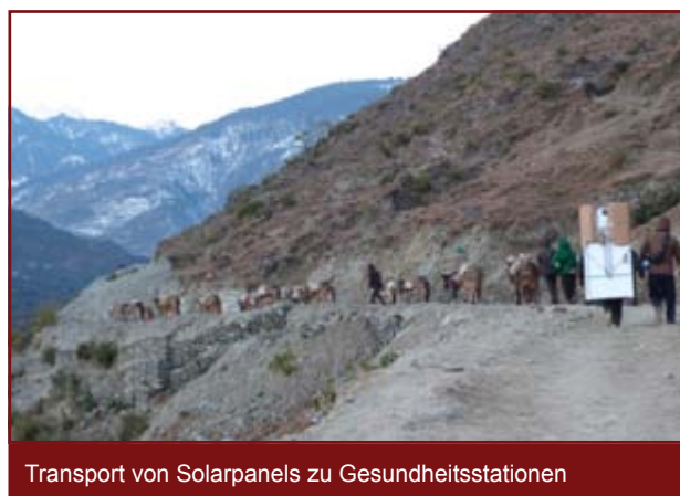
Transport von Solarpanels zu Gesundheitsstationen

Zur weiteren Verbesserung der medizinischen Versorgung in Nepal werden derzeit zwei Folgeprojekte vorbereitet: Die Mutterkindgesundheit in der Region soll mit dem Bau eines Schulungskrankenhauses und einer Fistula-Klinik verbessert werden, zudem wird die Pilotphase einer HNO-Klinik in deren ersten Jahren unterstützt werden.