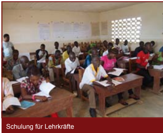
Schulung für Lehrkräfte