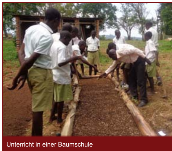
Unterricht in einer Baumschule

Aufbauend auf dem Nothilfe-Projekt in Kenia errichtet TERRA TECH seit November 2014 zusammen mit der örtlichen Bevölkerung, der lokalen Organisation Center for International Voluntary Service (CIVS) und dem Bundesministerium für wirtschaftliche Zusammenarbeit und Entwicklung (BMZ) einen Mikrodamm in Ahero, Kenia. Dazu wird ein ca. ein Meter hoher Damm errichtet, der in